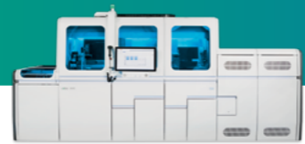
cobas® 8800 System