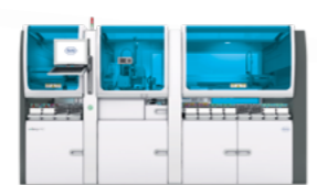
cobas® p 612 präanalytisches System