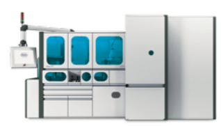
cobas® p 501 postanalytische Einheit