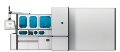
cobas® p 701 postanalytische Einheit