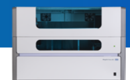
MagNA Pure 96 System