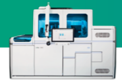
cobas® 6800 System