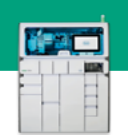
cobas® 5800 System