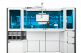
cobas® prime präanalytisches System