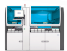
cobas® p 512 präanalytisches System

Roche bietet Ihnen kundenindividuelle Lösungen für Laborautomation. Ganz egal, ob kleines Labor oder integriertes Hochdurchsatzlabor.